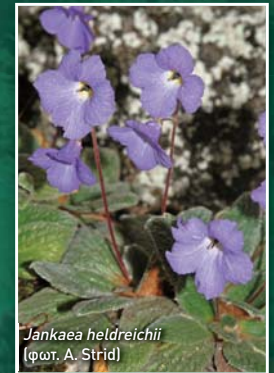
Jankaea heldreichii

III. Θέματα εξειδικευμένα και εφαρμοσμένα για την φυτική ποικιλότητα της Ελλάδας: α) Ενδημικά είδη, β) Σπάνια και Απειλούμενα είδη, γ) ξενικά και εισβλητικά είδη, δ) αρωματικά και φαρμακευτικά φυτά, ε) τα 10 σημαντικότερα οφέλη από την χλωρίδα και την ποικιλότητά της, ζ) τι κάνουν οι επιστήμονες των φυτών (βοτανικοί) κατά την εξερεύνηση της φύσης;