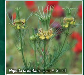
Nigella orientalis

στην Ελλάδα (στα όρη, στα νησιά, στους υγροτόπους, στις παράκτιες περιοχές), ανάδειξη των χαρακτηριστικών τους και της σημασίας τους. Η διαχρονική παρουσία του ανθρώπου και η βιοποικιλότητα στην Ελλάδα. Η χλωρίδα της Ελλάδας, ένας μοναδικός φυσικός πλούτος, ένα μοναδικό Μεσογειακό και παγκόσμιο απόθεμα. Τα αποξηραμένα φυτά και τα φυτά στη φύση. Παραδείγματα φυτών στο Βοτανικό Μουσείο (herbarium).